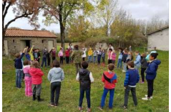
Louvettes et louveteaux lors de leur sortie d'octobre

Nous nous réjouissons de la vitalité du groupe !