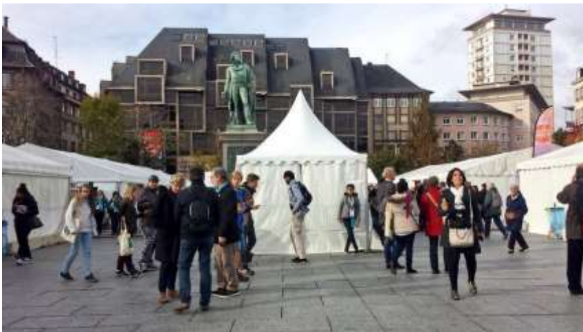
Stands de Protestants en fête dans le centre de Strasbourg

De quoi se sentir bien accueillis ! Le lendemain, nous avons participé comme les mille autres jeunes, au grand jeu « Game of tree ». Ce fut l'occasion de rencontrer des militants associatifs et de tester entre autres nos capacités à rester nous-même et à nous affirmer malgré la pression d'un groupe.