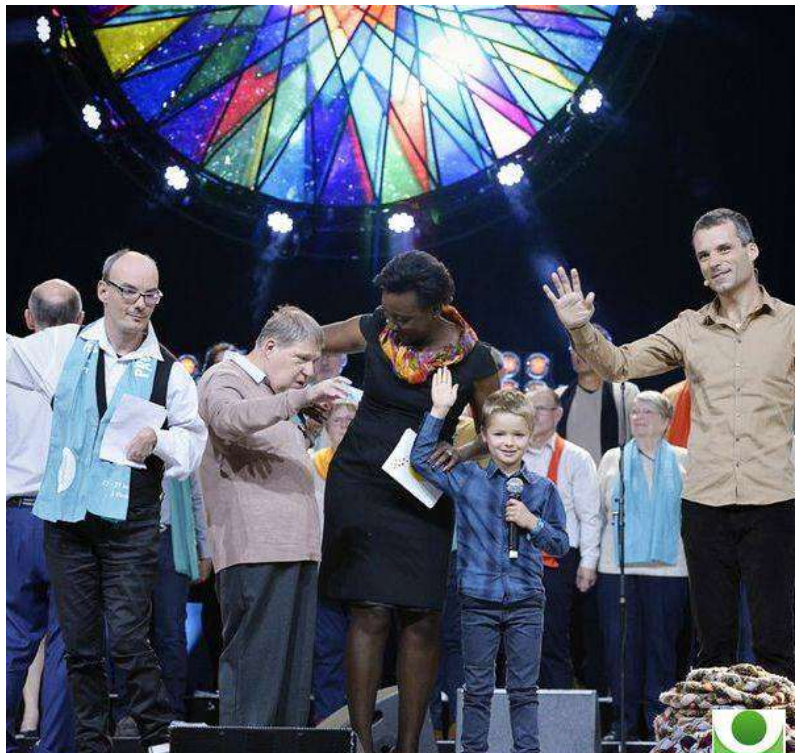
Lors du culte « XXL » de Protestants en fête

Cet office a été retransmis en direct sur France 2 dans le cadre de l'émission du « Jour du Seigneur » à l'horaire de la messe Catholique. L'offrande du culte a été destinée aux réfugiés.