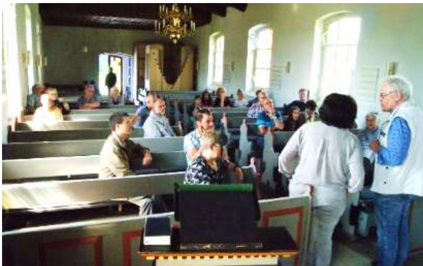
Visite de l'église de Barver