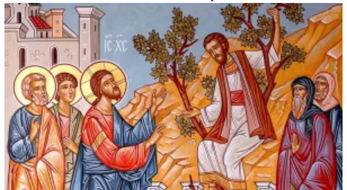
Icone de l'Eglise Orthodoxe Saint Nicolas le Thaumaturge (Toulouse)