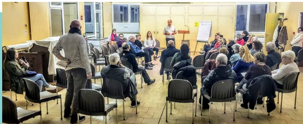
Grand débat à Terre Nouvelle. Février 2019