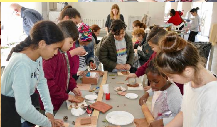
Avril 2019. Week-end Famille : ateliers créatifs et coopératifs, jeux en groupes...